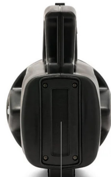
VANO BATTERIA - BATTERIA SOSTITUIBILE BATTERY COMPARTMENT - REPLACABLE BATTERY