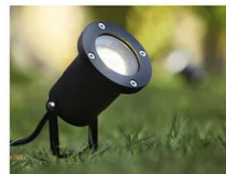
USE IN THE GARDEN