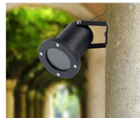
USE ON THE WALL