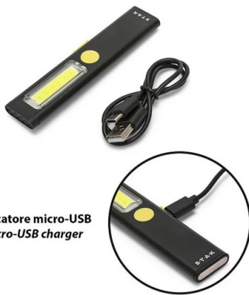
Caricatore micro-USB Micro-USB charger