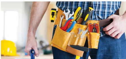
EASY TO CARRY