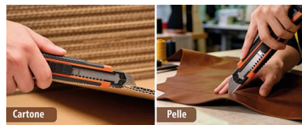
ADATTO PER TAGLIARE QUALSIASI TIPO DI MATERIALE Suitable for cutting any type of material