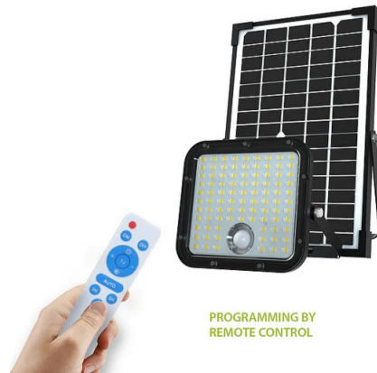
PROGRAMMING BY REMOTE CONTROL