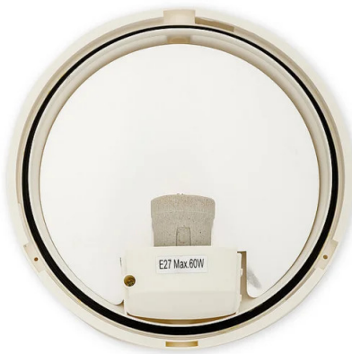
In the interior