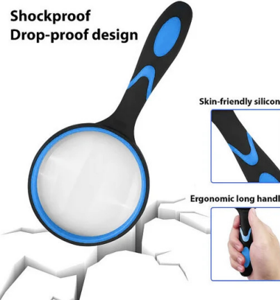
Shockproof Drop-proof design