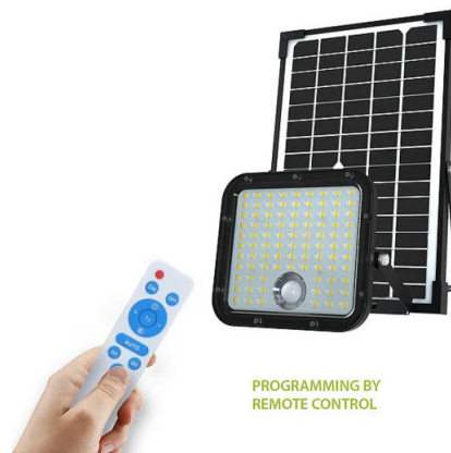
PROGRAMMING BY REMOTE CONTROL